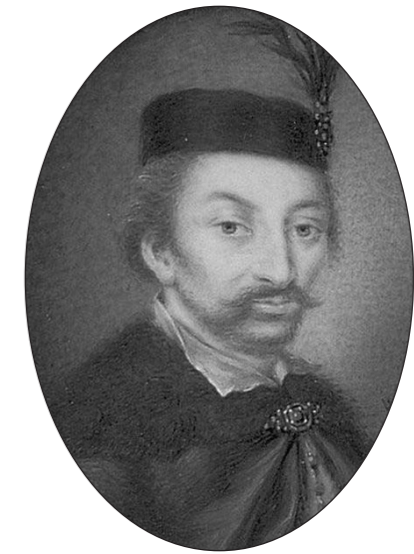
Ryc. 14. Stanisław Żółkiewski, starosta hrubieszowski w latach 1588-1620.