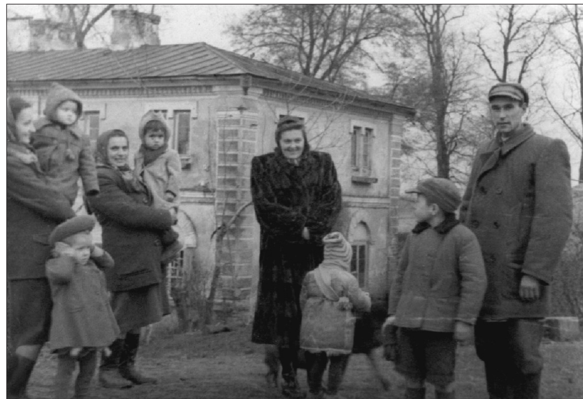
Ryc. 52. Rodzice i dzieci na tle dworu w Mołodiatyczach przebudowanego około 1937 r. z dawnej oficyny, fot. z początku lat 50-tych, ze zb. Z. Kozak.