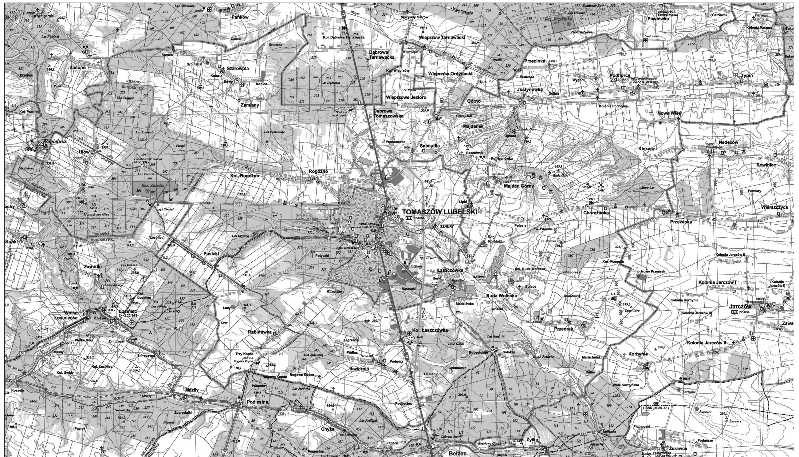
Współczesna mapa Gminy Tomaszów Lubelski.