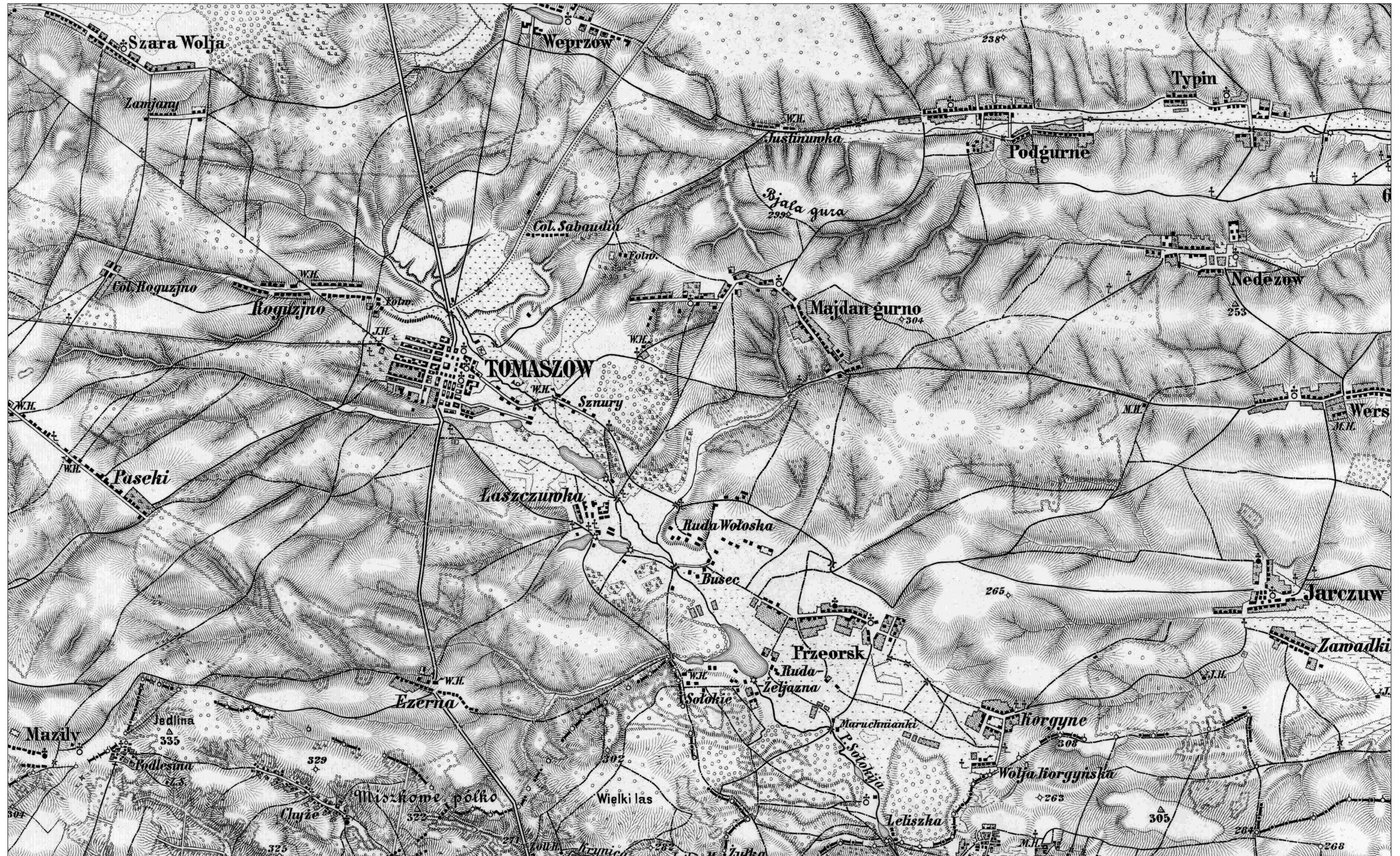
Tereny obecnej Gminy Tomaszów Lubelski na mapie z 1878 roku wg www.mapywig.org .